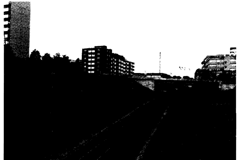
Abb. 1 Bahndamm bei Schwalbach-Limes/Ts.

Die Falterarmut am Bahndamm in Schwalbach-Limes wird sich wohl auch in Zukunft nicht entscheidend ändern. Die Landschaft des Vordertaus wurde in den letzten Jahrzehnten durch Intensivierung der Landwirtschaft — mit allen ungünstigen Begleiterscheinungen, wie Einsatz von Pestiziden und großzügige Verwendung von Kunstdünger — und Zersiedelung irreversibel verändert, so daß auch auf den verbliebenen »Naturflächen« Insekten kaum noch Lebensmöglichkeiten vorfinden, so daß sogar die Ubiquisten wie P. icarus selten werden.